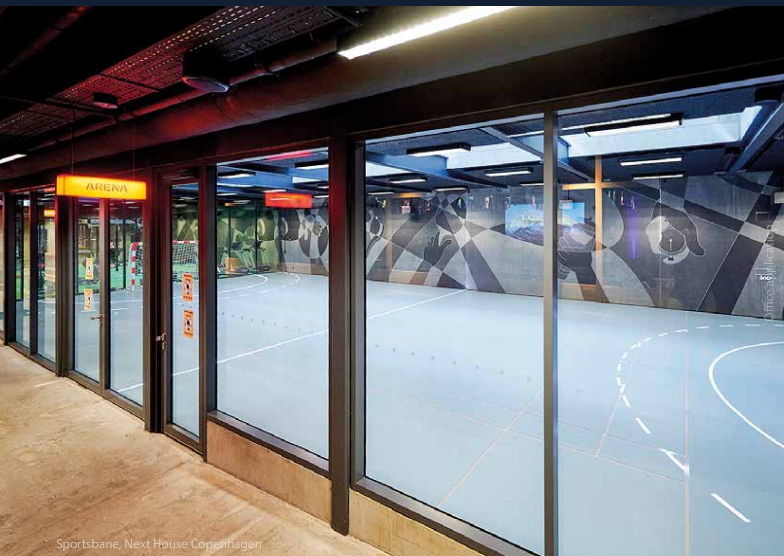
Sportsbane, Next House Copenhagen