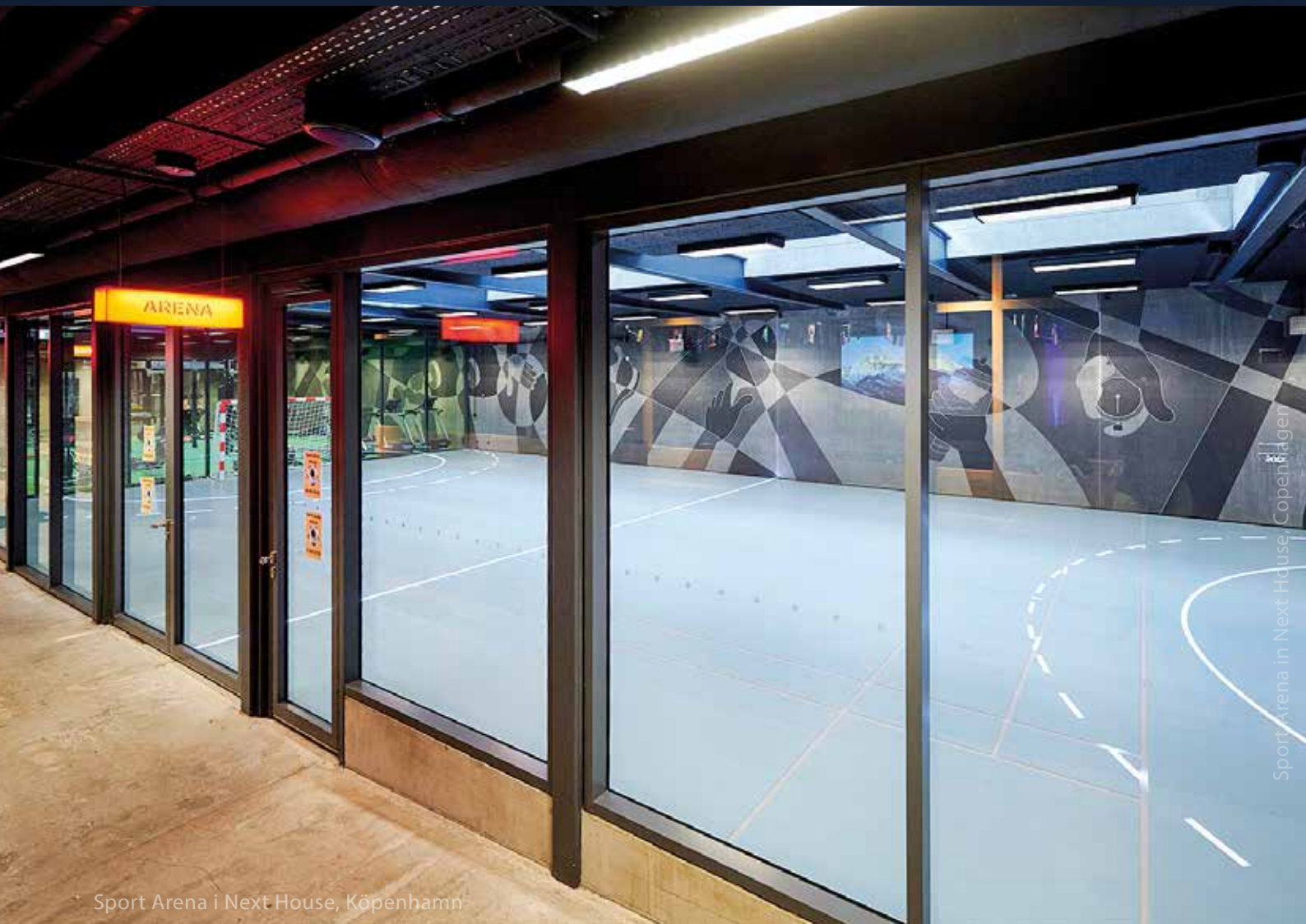
Sport Arena i Next House, Köpenhamn