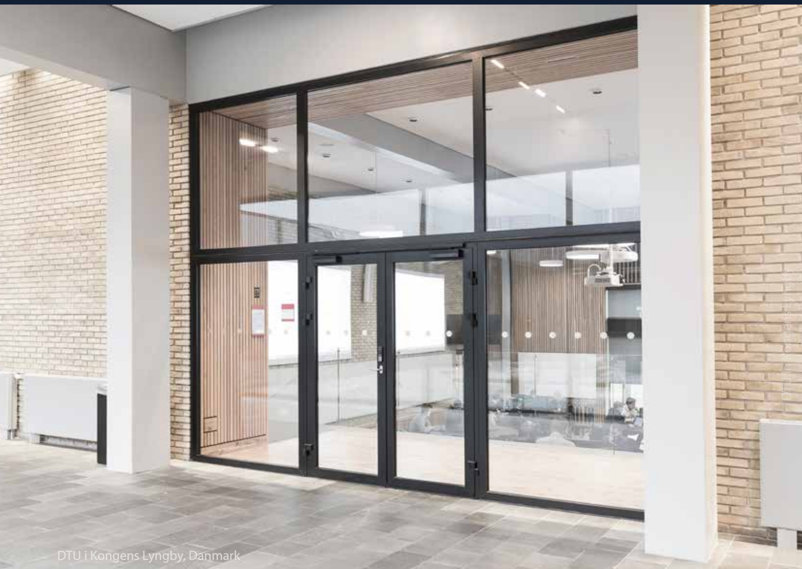
DTU i Kongens Lyngby, Danmark