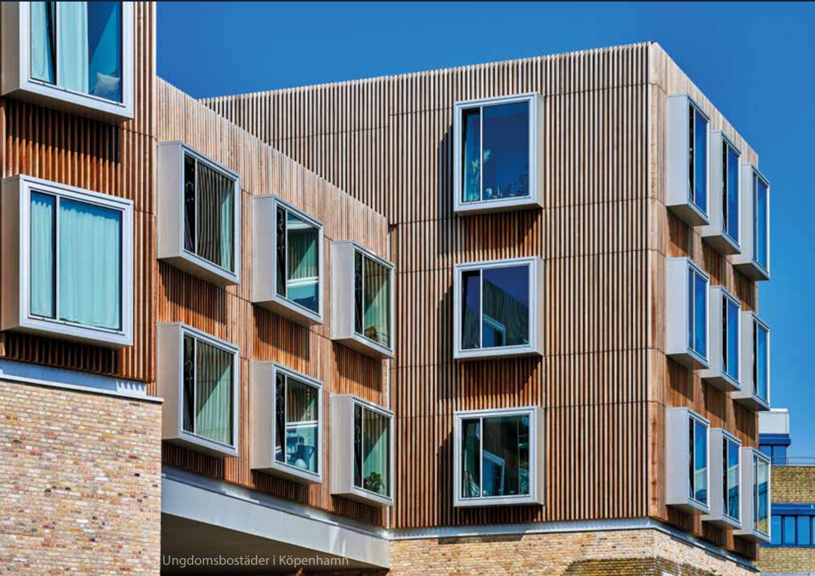
Ungdomsbostäder i Köpenhamn