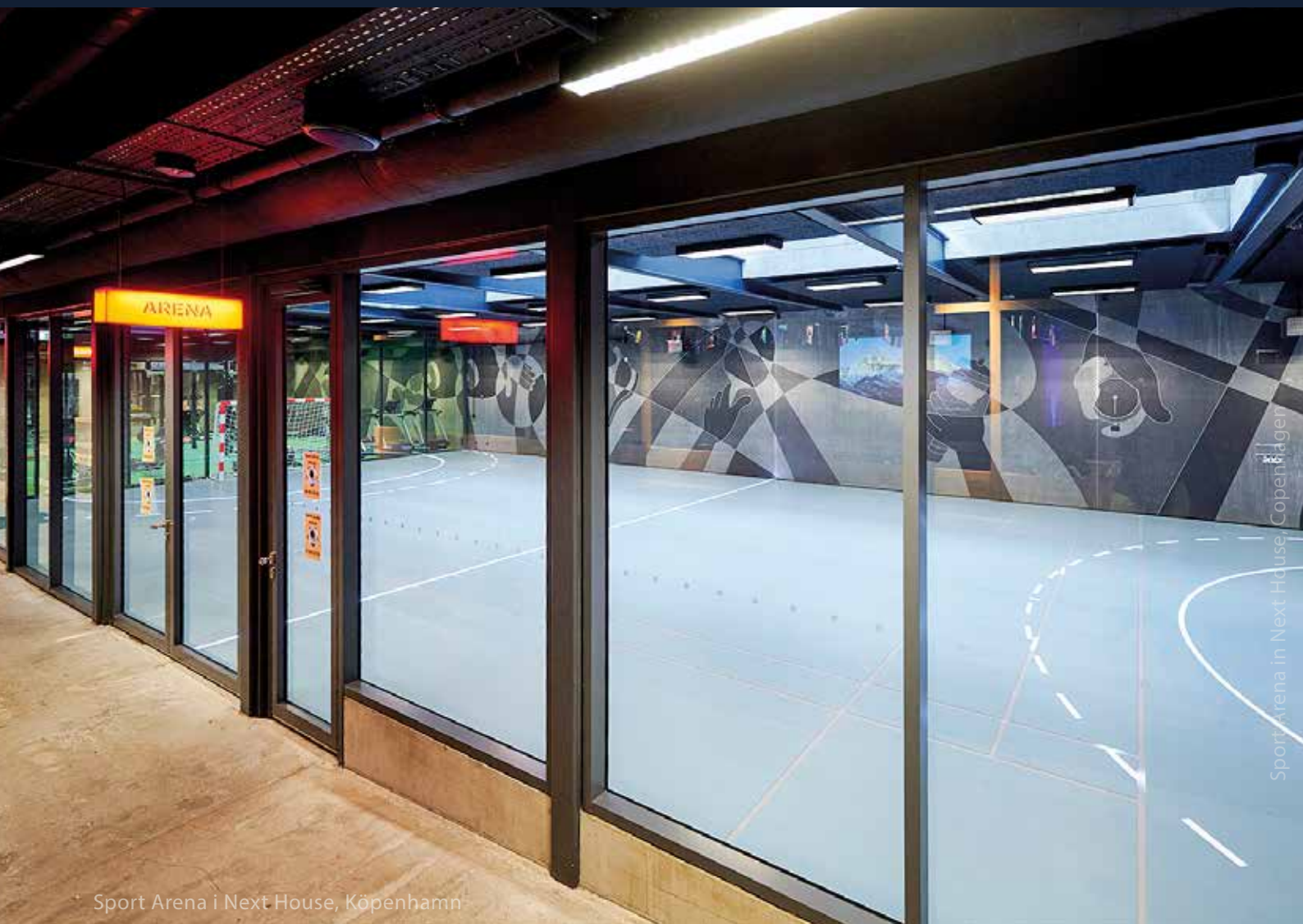
Sport Arena i Next House, Köpenhamn