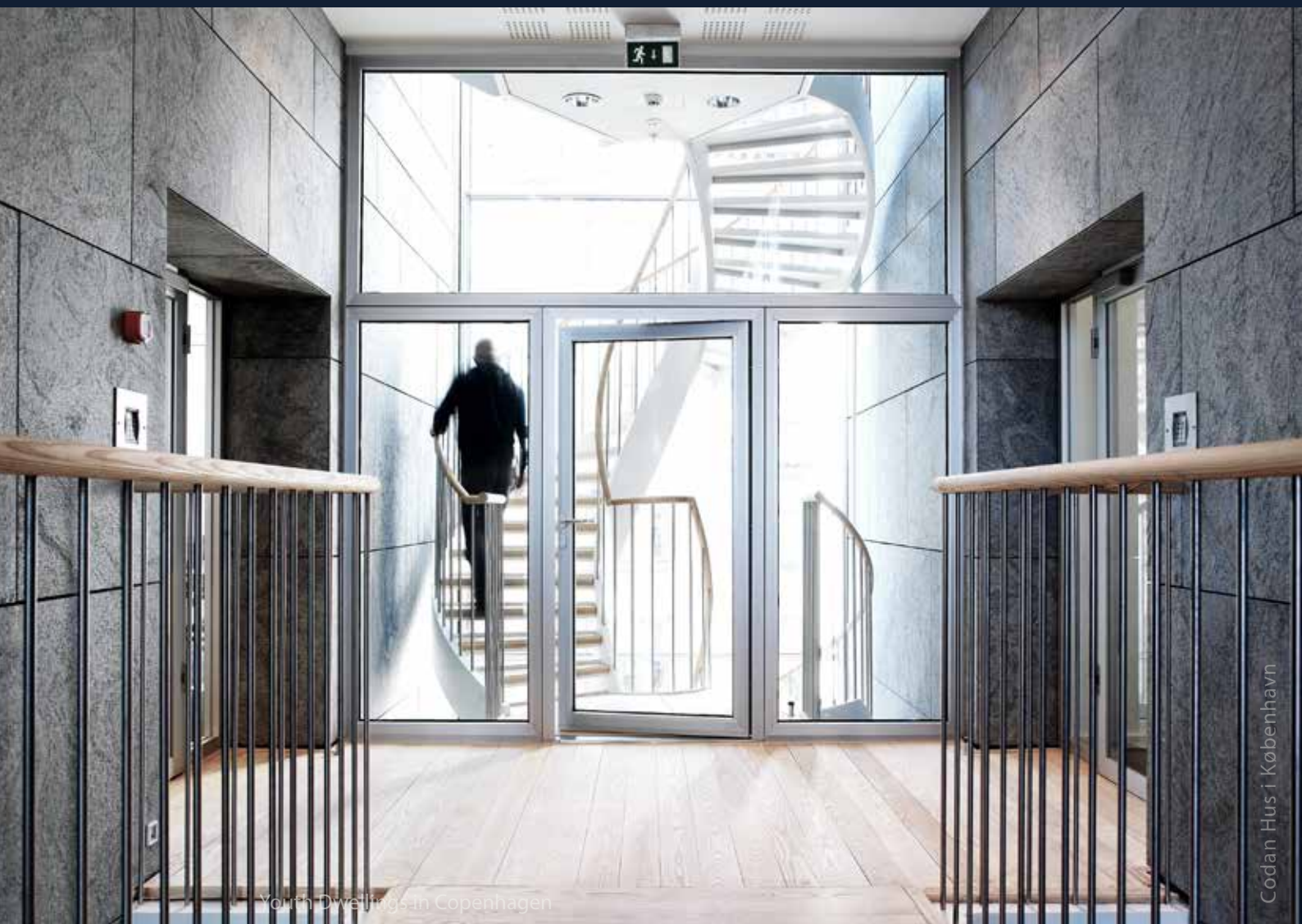
YOUTH DWELLINGS IN COPENHAGEN