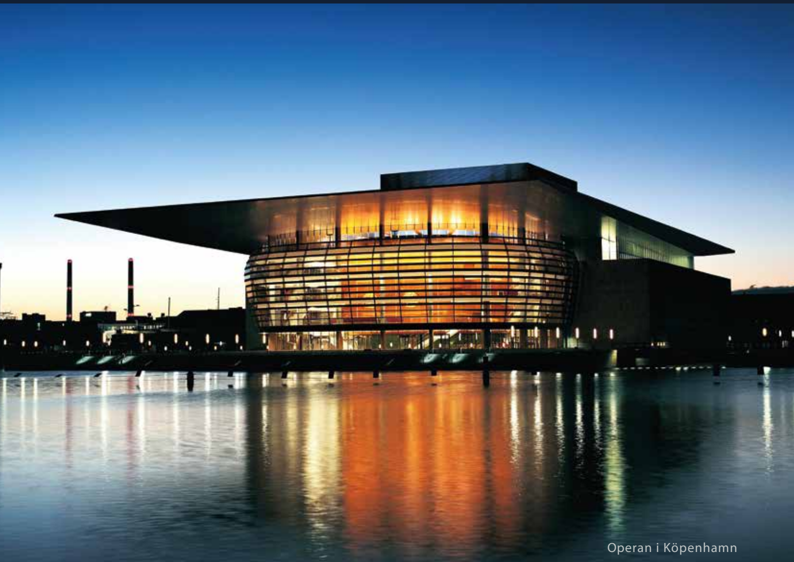
Operan i Köpenhamn