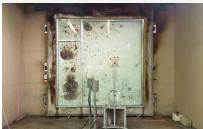
Fotot visar provet efter att 60-minuterstestet var avslutat. Vy från den oexponerade sidan.